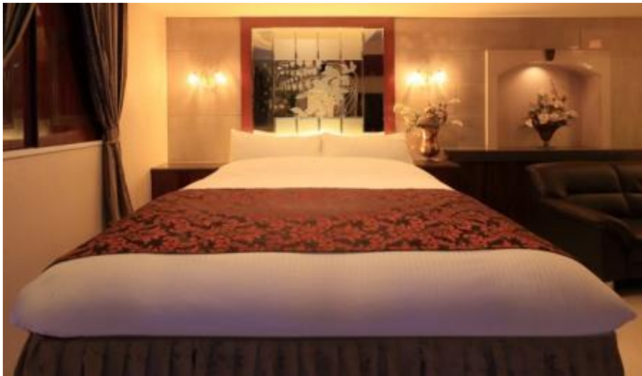
ホテルに行く前にやる事があります

た人生を送ることが究極の目的のはずです。であれば結婚は一刻も早い方がいい！ 結婚する気が無い勤務医にこだわって、時間を浪費するようなゆとりは無いのです。 もし相手勤務医が結婚する気が無いと判れば、直ぐに方向転換して結婚したい勤務 医を探し出してアプローチする！この決断と行動が求められます。