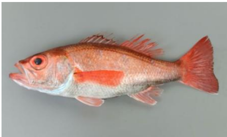
なかなか獲れない高級魚「アカムツ」

「白身のトロ」という異名を持つ高級魚「アカムツ」を捕獲は至難です。そして当然ながら「アカムツ」は自分から漁師の方に寄ってはきません。