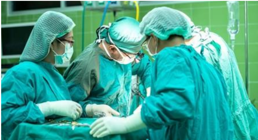
仕事に誠実に向き合う勤務医は効率第一です

手練れで一流のハンターや漁師は、一度狙った獲物はほとんどこだわって捕獲を試みます。シカを狙っていたハンターが、突然イノシシが現れても仕留めようとはしません。「アカムツ」に固執する漁師が、マグロがいても釣りあげようとはしないでしょう。そもそもエサが違ふし、捕獲手段も全く異なり獲った時の始末にも困ります。ところが勤務医との婚活においては、シカを獲ろうとして途中からイノシシを追いかけたり、「アカムツ」を釣ろうと意図しながらマグロを追いかけるといった行為と似たような事例が後を絶ちません。当然、こういったケースが上手くいくはずもなく、たいていは惨敗に終わってしまいます。